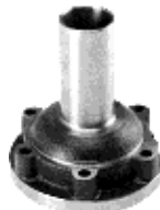
GUÍA DE DIRECTA 312/3500 312 261 1818