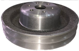
POLEA BOMBA DE AGUA 1114/1517 352 202 0210