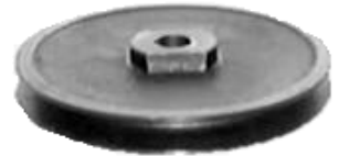
POLEA DIRECCIÓN HID 1114 352 236 0010