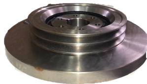
POLEA CIGÜEÑAL BALANCEADOR OM366 OH1315 366 030 0903