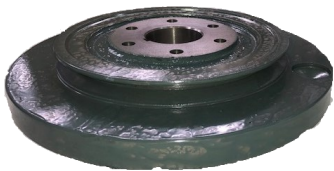
POLEA CIGÜEÑAL BALANCEADOR 1114 1 CANAL 352 030 1503