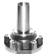
GUÍA DE DIRECTA 1114 CON RETEN 312 261 1818-X