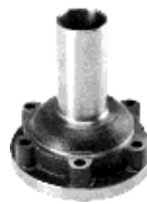
GUÍA DE DIRECTA 608 CON RETEN 314 261 0518-X