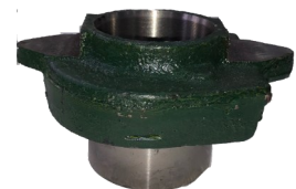
PORTA RULEMAN DE EMBRAGUE 3500/1114 312 250 1315