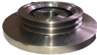
POLEA CIGÜEÑAL BALANCEADOR 1114/1517 2 CANALES 352 030 1603