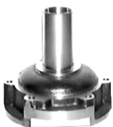
GUÍA DE DIRECTA DE CAJA G-50/G-60