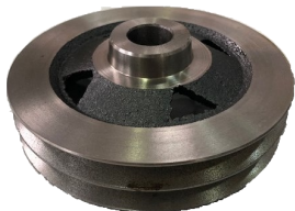
POLEA COMPRESOR KNORR MB 1621